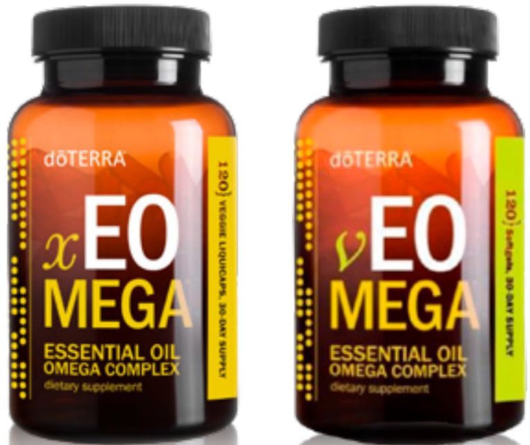
Omega 3 aus Fisch

dōTERRA xEO / vEO Mega Essential Oil Omega Complex ist eine einzigartige Formel aus CPTG Certified Pure Therapeutic Grade® ätherischen Ölen und einer proprietären Mischung von Omega-Fettsäuren aus dem Meer und vom Land. Omega-Fettsäuren unterstützen die Gesundheit der Gelenke, des Herz-Kreislauf-Systems und des Gehirns und fördern eine gesunde Immunfunktion. Eine Portion xEO Mega liefert 900 Milligramm mariner Lipide (mit 300 mg EPA, 300 mg DHA und 70 mg anderer Omega-3-Fettsäuren) und eine Mischung aus 250 mg Fettsäuren pflanzlichen Ursprungs. xEO Mega enthält außerdem 800 IU natürliches Vitamin D, 60 IU natürliches Vitamin E und 1 mg Astaxanthin, ein starkes antioxidatives Carotinoid, das aus Mikroalgen gewonnen wird. xEO Mega ist in einer vegetarierfreundlichen Weichkapsel verkapselt.